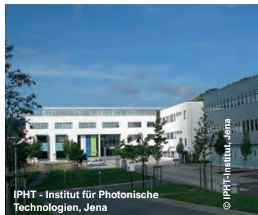
IPHT - Institut für Photonische Technologien, Jena

Interfakultäres Institut für Biochemie, Tübingen Karlsruher Institut für Technologie (KIT), Eggenstein-Leopoldshafen Karlsruher Institut für Technologie (KIT), Karlsruhe Leibniz-Institut DSMZ, Braunschweig Leibniz-Institut für Naturstoff-Forschung und Infektionsbiologie - Hans-Knöll-Institut, Jena Leibniz-IPHT, Jena MPI Max-Planck-Institute für Biologie des Alterns, Köln für biologische Intelligenz, Seewiesen und Martinsried für Chemie, Universität Mainz für Herz- und Lungenforschung, Bad Nauheim für Kohlenforschung, Mülheim an der Ruhr für Multidisziplinäre Naturwissenschaften, Göttingen für Quantenoptik, Garching für molekulare Biomedizin, Münster für Psychiatrie, PCC (Preclinical Center), München MZE Materialwissenschaftliches Zentrum für Energiesysteme, Karlsruhe PIH-Frankenthal Pfalzinstitut für Hören und Kommunikation, Frankenthal PTB Physikalisch-Technische Bundesanstalt, Walther-Meißner-Bau, Berlin Wehrwissenschaftliches Institut für Schutz- technologien (WIS), Munster ZMM - Zentrum für Mikrosysteme und Materi- alien, Berlin