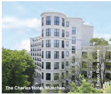
The Charles Hotel, München

Adlon Palais, Berlin AFRC Europe Purchasing Department, Garmisch-Partenkirchen CGH Catering GmbH Himmelsthür - Großküche Emmerke, Giesen DJH Jugendherberge, Düsseldorf Eibsee-Hotel - Küche, Grainau Essential by Dorint Stuttgart-Airport, Leinfelden-Echterdingen Forum Sankt Hubert, Kempen Gasthaus Barthels Hof, Leipzig Gaststätte Nordbahnhof, Krefeld