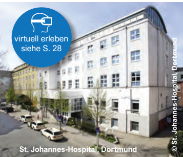
St. Johannes-Hospital, Dortmund