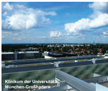
Klinikum der Universität München-Großhadern

Klinik, Löwenstein Kliniken, Sindelfingen Kliniken der Stadt Köln - Kinderkrankenhaus, Köln Kliniken des Landkreises Lörrach GmbH, Lörrach Kliniken Maria Hilf, Mönchengladbach Klinikum Leer Klinikum Heidenheim Klinikum Fürstfeldbruck Klinikum Lüneburg Klinikum Bayreuth Klinikum Bad Hersfeld Klinikum Wolfsburg Klinikum Osnabrück Klinikum Memmingen Klinikum Itzehoe Klinikum Bielefeld Mitte Klinikum Bremen-Mitte Klinikum der Universität München Chirurgische Klinik, München Klinikum der Universität München- Großhadern Klinikum Dortmund gGmbH, Klinikzentrum Nord - Zentral-OP, Dortmund Klinikum Leverkusen gGmbH, Leverkusen Klinikum Lippe, Detmold Klinikum rechts der Isar, München Klinikum Stuttgart - Katharinenhospital, Stuttgart Klinikum Stuttgart - Krankenhaus Bad Cannstatt, Stuttgart Klinikum Stuttgart - Olgahospital / Frauenklinik, Stuttgart Klinikum Südstadt, Rostock Klinikum Vest GmbH, Recklinghausen Klinikverbund Südwest - Kreiskliniken, Böblingen