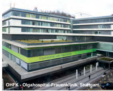
OHFK - Olgahospital-Frauenklinik, Stuttgart

Sana Kliniken Niederlausitz, Senftenberg