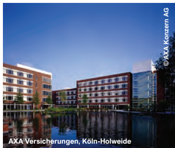
AXA Versicherungen, Köln-Holweide

ADFORS Deutschland GmbH, Neustadt Adolf-Würth GmbH & Co. KG - Vertriebszentrum West, Künzelsau Advanced Nuclear Fuels GmbH, Lingen Advanced Pharma GmbH, Berlin Allflex Folienveredelung, Aachen Aluminium Norf GmbH, Neuss Amadeus Data Processing GmbH, Erding Ärztekammer Nordrhein, Düsseldorf Aspen Bad Oldesloe GmbH (GSK), Bad Oldesloe Audi AG, Ingolstadt Bayer AG CropScience Division, Monheim Bayerischer Rundfunk, München Bernd Kraft GmbH, Duisburg Bertelsmann AG, Gütersloh Berufsgenossenschaft Handel und Warendistribution, Essen Blink AG, Jena Blockheizkraftwerk, Osnabrück Buchhandlung ZAP, Brügge Bürogebäude Herzog-Terrassen (ehem. West LB), Düsseldorf Bürogebäude Hindenburgstraße, GWG Gruppe, Ludwigsburg Bürogebäude Junghofstraße, Frankfurt Bürogebäude Koblenzer Straße, Siegen Bürogebäude Neumühlen, Hamburg Bürogebäude Pafebruch, Mamer Bürogebäude Rathenauplatz, Frankfurt Bürogebäude Steindamm, Hamburg Bürogebäude Willi-Brandt-Straße, Hamburg Bürohaus „Trade“, Frankfurt Bürohaus Morrow, Frankfurt BVG Berliner Verkehrsbetriebe AöR, Berlin BYK-Chemie GmbH, Wesel Carl Zeiss, Aalen Clariant Industriepark Höchst, Frankfurt