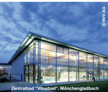
Zentralbad "Vitusbad", Mönchengladbach

Baureferat - Technisches Rathaus Bayerische Versicherungskammer Messe - Anlage Küche Ludwig-Maximilian-Universität Tierärztliches Gesundheitszentrum München Klinik Thalkirchner Str. Hochhaus Uptown Museum Villa Stuck Monachia Grundstücks-AG Städtisches Klinikum München - Klinikum Harlaching Muffathalle Deutsches Theater Münchener Rückversicherungsgesell- schaft, "Münchner Tor" und Hauptverwaltung Tierpark Hellabrunn Passivhaus Seitzstraße Jüdisches Museum Zahnklinik der Universität München Klinikum der Universität München Chirurgische Klinik The Charles Hotel Polizeipräsidium "Löwengrube" Bayerischer Rundfunk Cuvilliéstheater Wacker Chemie AG U-Bahnhof Hauptbahnhof Knorr-Bremse AG Schulzentrum Quiddestraße Bayerisches Nationalmuseum Prinzregententheater Krankenhaus Barmherzige Brüder München Klinik Schwabing