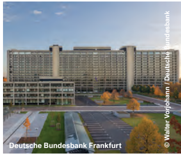
Deutsche Bundesbank Frankfurt

AOK Bayern, Kaufbeuren ARAG AG, Düsseldorf AXA Versicherungen, Köln-Holweide Bayerische Versicherungskammer, München Continental Versicherungsbund, Dortmund Deutsche Rentenversicherung Bayern Süd, Landshut Deutsche Rentenversicherung Hessen, Bad Nauheim ERGO Versicherungsgruppe AG, Düsseldorf Generali Informatik Services, Aachen IAG Institut für Arbeit und Gesundheit der Dt. Gesetzl. Unfallversicherung, Dresden Kassenzahnärztliche Vereinigung Nieder- sachsen, Hannover Münchener Rückversicherungsgesellschaft, "Münchener Tor" und Hauptverwaltung, München Provinzial Versicherungen, Düsseldorf Signal Iduna, Dortmund