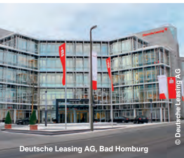
Deutsche Leasing AG, Bad Homburg

Aareal Bank, Wiesbaden Anbank, Luxemburg Bank im Bistum Essen, Essen Banque de Luxembourg, Luxemburg Deutsche Bank "Unter den Linden", Berlin Deutsche Bundesbank in Minden, Essen, Dortmund, Oldenburg, Magdeburg, Berlin, Hannover und Frankfurt Deutsche Leasing AG, Bad Homburg Kreissparkasse, Ludwigsburg LBBW Landesbank Baden-Württemberg, Stuttgart Nassauische Sparkasse, Wiesbaden NRW.Bank, Münster Postbank, Nürnberg Sparkasse in Willich, Neuss, Kempen, Regensburg, Krefeld (Ostwall, Vluyners Platz, Rheinstr.), Aschaffenburg-Alzenau, Siegen-Kreuztal und Wuppertal UniCredit Luxembourg S.A., Luxemburg Volksbank in Paderborn, Kempen und Krefeld (Hauptgeschäftsstelle)