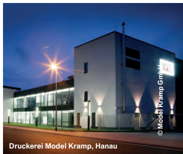
Druckerei Model Kramp, Hanau

BDC Business Development Center, Heidelberg BerlinBioCube - Campus, Berlin-Buch Deutsches Krebsforschungszentrum, Heidelberg Evotec SE, Hamburg Exzellenzcluster CECAD, Köln