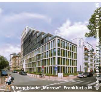
Bürogebäude „Morrow“, Frankfurt a.M.

Technische Universität München Max-Planck-Institute für Quantenoptik Ludwig-Maximilian-Universität - CALA