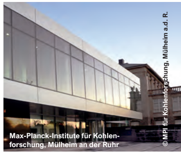
Max-Planck-Institute für Kohlen- forschung, Mülheim an der Ruhr

Deutsches Diabetes-Forschungsinstitut, Düsseldorf DRK Blutspendendienst Nord-Ost GmbH - Institut Lütjensee EMBL European Molecular Biology Laboratory, Heidelberg Forschungsbau Excellence Cluster Car- dio-Pulmonary Systems, ECCPS Gießen Forschungszentrum, Jülich Fraunhofer IGCV (Institut für Gießerei-, Composite- und Verarbeitungstechnik), Garching bei München Fraunhofer-Institut für Grenzflächen- und Bioverfahrenstechnik (IGB), Stuttgart Fraunhofer-Institut für Holzforschung Wil- helm-Klauditz-Institut (WKI), Braunschweig Fraunhofer-Institut für Toxikologie und Exper- imentelle Medizin ITEM, Hannover Helmholtz Zentrum für Infektions-Forschung, Braunschweig IFW Leibniz-Institut für Festkörper- und Werkstoffforschung, Dresden Institut für Kunststoffverarbeitung - RWTH, Aachen Institut für Pharmazie und Lebensmittelche- mie - Universität, Würzburg