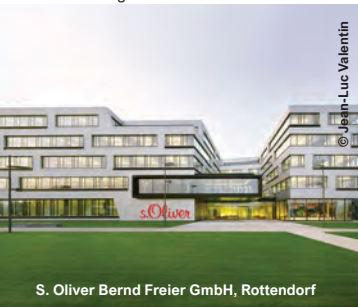
S. Oliver Bernd Freier GmbH, Rottendorf

CACTUS Supermarché, Bascharage Edeka-Markt, Hamburg Geschäftshaus Leopoldstraße, München Ikea in Augsburg, Oldenburg, Hamburg und Bremerhaven