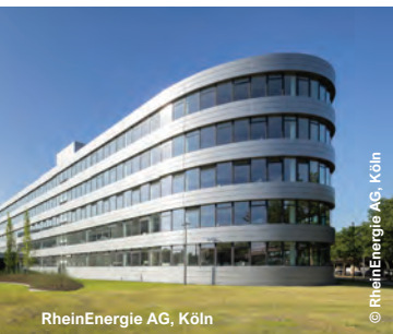
RheinEnergie AG, Köln

Adolf-Würth GmbH & Co. KG - Vertriebszentrum West