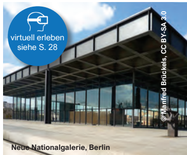
Neue Nationalgalerie, Berlin

Tonhalle Düsseldorf Justizvollzugsanstalt, Bernau Kloster Loccum - Predigerseminar / NB Bibliothek, Hannover, Rehburg Klosterkirche Marienthal, Hamminkeln Konzerthaus am Gendarmenmarkt, Berlin KOSMOS UFA-Palast, Berlin Kulturwerkstatt „Auf AEG“, Nürnberg Kunsthalle, Hamburg Kunstmuseum, Wolfsburg Kunstmuseum, Stuttgart Langer Eugen, UN Campus, Bonn MARKK - Museum am Rothenbaum, Hamburg Maternushaus, Köln Münchener Kammerspiele, München Museum für Naturkunde, Berlin Museum Villa Stuck, München Neue Nationalgalerie, Berlin Oper Köln Paderhalle, Paderborn Prinzregententheater, München Residenztheater, München Schauspielhaus, Kiel Schwarzwaldhalle, Karlsruhe Service Parcs Luxembourg - Werkhalle Reckenthal, Luxemburg Stadt Westerland - Kurbetrieb, Westerland Städt. Kramer Museum, Kempen Stage Theater am Potsdamer Platz, Berlin Theater Paderborn - Westfälische Kammerspiele, Paderborn Tierpark Hellabrunn, München Tonhalle, Düsseldorf TÜV Rheinland Akademie, Ossendorf, Köln Wichern-Werkstätten, Landau Zukunftszentrum, Herten