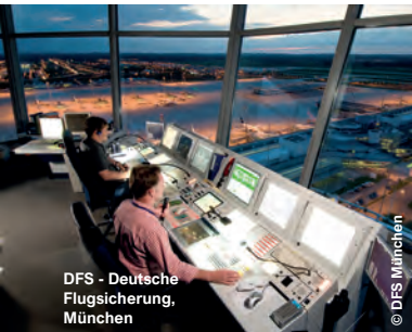
DFS - Deutsche Flugsicherung, München