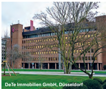
DeTe Immobilien GmbH, Düsseldorf

Deutsche Bahn AG, Zentrum DB Cargo, Duisburg Posthauptvermittlungsstelle, Essen Telekom-Gebäude (Fernmeldeamt 1), Düsseldorf U-Bahnhof Hauptbahnhof, München üstra Hannoversche Verkehrsbetriebe AG, Hannover