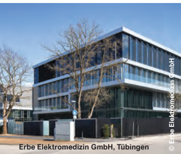
Erbe Elektromedizin GmbH, Tübingen