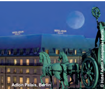
Adlon Palais, Berlin

KOSMOS UFA-Palast Deutsche Bank "Unter den Linden" Stage Theater am Potsdamer Platz Advanced Pharma GmbH Bundeskanzleramt Deutsche Bundesbank Adlon Palais Sana-Klinikum Lichtenberg Staatsbibliothek zu Berlin BHT Berliner Hochschule für Technik Marie-Elisabeth-Lüders-Haus Museum für Naturkunde DRK Kliniken Berlin Köpenick