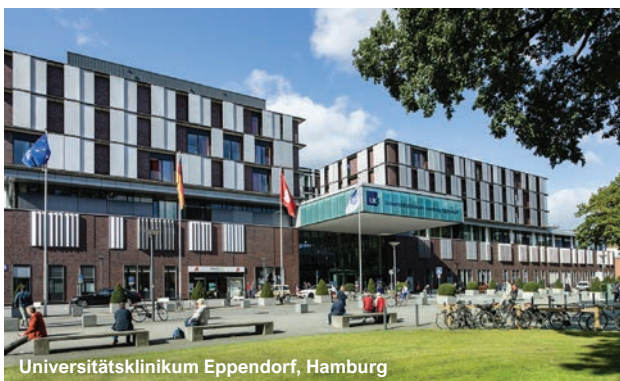
Universitätsklinikum Eppendorf, Hamburg

Krankenhaus Tabea GmbH, Hamburg Kreisklinik, Wolfratshausen Kreiskliniken, Reutlingen Kreisklinikum, Siegen Kreiskrankenhaus, Freiberg Kreiskrankenhaus des Vogelsbergkreises, Alsfeld KRH Klinikum Siloah, Hannover Landesklinikum Mostviertel, Amstetten Leben & Wohnen - Parkheim Berg, Stuttgart Leopoldina Krankenhaus, Schweinfurt Lubinus Clinicum, Kiel Luisenhospital, Aachen LVR-Kliniken, Süchteln, Viersen Maison de Soins, Clervaux Maria-Hilf-Krankenhaus, Bergheim Marien Hospital, Witten Marienhospital, Stuttgart Medical Park Loipl, Bischofswiesen medius Klinik Nürtingen Medizinische Universität Lausitz - Carl Thiem, Cottbus München Klinik Harlaching, Schwabing & Thalkirchner Straße Niels-Stensen-Kliniken - Krankenhaus St. Raphael, Ostercappeln Nikolauspflge, Stuttgart Oberschwabenklinik - St. Elisabethen-Klinikum, Ravensburg Ökumenisches Hainich Klinikum, Mühlhausen Ortenau Klinikum, Lahr-Ettenheim Orthoklinik, Lüneburg Rehabilitationszentrum am Sprudelhof, Bad Nauheim Rheinland Klinikum, Dormagen Rhein-Maas Klinikum GmbH, Würselen RKH Kliniken, Ludwigsburg RKH Orthopädische Klinik, Markgröningen RKH-Kliniken, Bietigheim Robert Bosch Krankenhaus, Stuttgart Robert-Bosch-Krankenhaus, Standort City, Stuttgart Sana Hanse-Klinikum, Wismar Sana Kliniken Niederlausitz, Senftenberg Sana Krankenhaus Benrath, Düsseldorf Sana-Klinikum Lichtenberg, Berlin