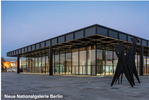
Neue Nationalgalerie Berlin