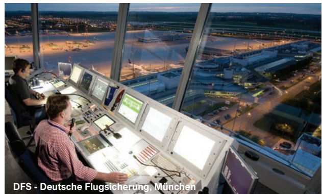
DFS - Deutsche Flugsicherung, München

BVG Berliner Verkehrsbetriebe AöR, Berlin Deutsche Bahn AG, Zentrum DB Cargo, Duisburg DFS - Deutsche Flugsicherung, München EGN Entsorgungsges. Niederrhein mbH, Viersen Flughafen - Verwaltungsgebäude, Düsseldorf Flughafen Niederrhein, Weeze-Laarbruch Fraport AG, Flughafen, Frankfurt Kölner Verkehrs-Betriebe AG (KVB), Köln Posthauptvermittlungsstelle, Essen Rheinbahn AG, Düsseldorf Telekom-Gebäude (Fernmeldeamt 1), Düsseldorf U-Bahnhof Hauptbahnhof, München üstra Hannoversche Verkehrsbetriebe AG, Hannover