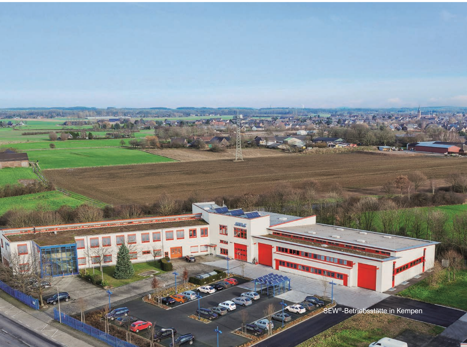
SEW®-Betriebsstätte in Kempen