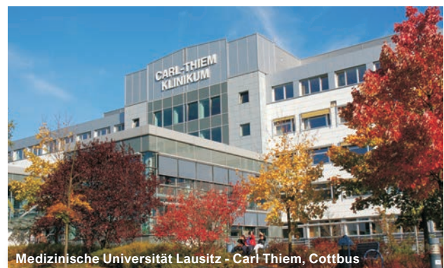
Medizinische Universität Lausitz - Carl Thiem, Cottbus

Gesundheit Nord gGmbH - Klinikum Bremen-Mitte, Bremen Gesundheitszentrum, Tübingen GFO Klinik Brühl - Marienhospital, Brühl GFO Kliniken Troisdorf - St. Josef Hospital, Troisdorf Haus Hörn Altenzentrum und Hospiz, Aachen Heilig-Geist-Krankenhaus, Köln Helios Klinik, Lengerich Helios Klinikum, Krefeld Helios Klinikum, Schleswig Herz- und Diabeteszentrum, Bad Oeynhausen Hessenklinik Stadtkrankenhaus Korbach, Korbach Hôpital Kirchberg, Luxemburg Hospital zum Heiligen Geist, Frankfurt Hospital zum Heiligen Geist, Kempen InnKlinikum, Altötting & Mühldorf a. Inn Johanna Etienne Krankenhaus, Neuss Johanniter Krankenhaus, Bonn Kassenzahnärztliche Vereinigung Niedersachsen, Hannover Kath. Marienkrankenhaus, Hamburg Kath. St. Paulus Gesellschaft - St. Marien Hospital, Lünen KEM Evang. Kliniken Essen-Mitte, Essen Kliniken, Sindelfingen Kliniken der Stadt Köln - Kinderkrankenhaus, Köln Kliniken des Landkreises Lörrach GmbH, Lörrach Kliniken Maria Hilf, Mönchengladbach Klinikum, Bad Hersfeld Klinikum, Bayreuth