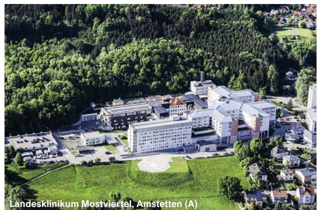
Landeskrankenhaus Mostviertel, Amstetten (A)