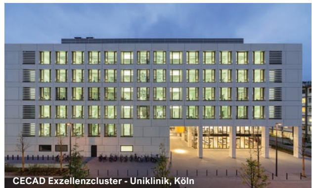
CECAD Exzellenzcluster - Uniklinik, Köln

Alfred-Wegener-Institut, Helgoland BDC Business Development Center, Heidelberg BerlinBioCube - Campus Berlin-Buch, Berlin Bio Nord Biotechnologiezentrum (BTZ), Bremerhaven Biomedizinisches Forschungszentrum Seltersberg der Justus-Liebig-Universität, Gießen Bundesanstalt für Materialforschung und -prüfung (BAM), Berlin Bundesinstitut für Arzneimittel und Medizinprodukte (BfArM), Bonn CECAD Exzellenzcluster - Uniklinik, Köln