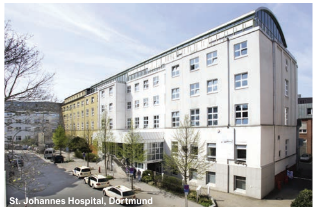
St. Johannes Hospital, Dortmund