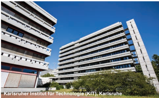
Karlsruher Institut für Technologie (KIT), Karlsruhe

LAVES Lebensmittel- und Veterinärinstitut, Braunschweig Leibniz-Institut DSMZ, Braunschweig Leibniz-Institut für Naturstoff-Forschung und Infektionsbiologie - Hans-Knöll-Institut, Jena Leibniz-Institut für Photonische Technologien e.V. (IPHT), Jena LNS Laboratoire National de Santé, Laborgebäude, Luxemburg Max-Planck-Institute für Biologie des Alterns, Köln; für biologische Intelligenz, Martinsried; für biologische Intelligenz, Seewiesen; für Chemie, Universität, Mainz; für Herz- und Lungenforschung, Bad Nauheim; für Kohlenforschung, Mülheim an der Ruhr; für molekulare Biomedizin, Münster; für Multidisziplinäre Naturwissenschaften, Göttingen; für Psychiatrie München, PCC (Preclinical Center), München für Quantenoptik, Garching bei München MZE Materialwissenschaftliches Zentrum für Energiesysteme, Karlsruhe PIH-Frankenthal Pfalzinstitut für Hören und Kommunikation, Frankenthal PTB Physikalisch-Technische Bundesanstalt, Walther-Meißner-Bau, Berlin Technologiepark Adlershof - Zentrum für Mikrosysteme und Materialien (ZMM), Berlin TUM Campus Straubing für Biotechnologie und Nachhaltigkeit, Straubing Wehrwissenschaftliches Institut für Schutztechnologien (WIS), Munster ZBMT - Zentrum für Biomedizintechnik, Aachen ZENIT GmbH, Magdeburg