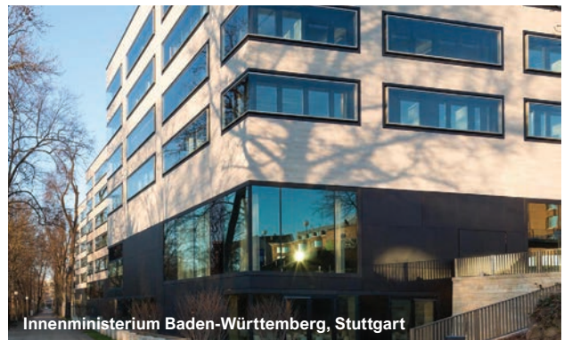
Innenministerium Baden-Württemberg, Stuttgart

Bayerisches Landesamt für Gesundheit und Lebensmittelsicherheit, Oberschleißheim Bayerisches Landesamt für Umwelt, Augsburg Bundeskanzleramt, Berlin Bundeswehr - Materiallager Luttenbachstraße, Neckarzimmern Bundeswehr-Kastagnette Nordfriesland, Bramstedtlund CUA - Chemisches Untersuchungsamt, Bochum Festhalle, Elsdorf Feuerwache 4 - Schwabing, München Gemeindewerke, Greifath Haus der Abgeordneten Baden-Württemberg, Stuttgart Innenministerium Baden-Württemberg, Stuttgart Justizvollzugsanstalt, Bernau Kreisverwaltung, Viersen Kulturzentrum Berliner Platz, Arnberg Kursaal Bad Cannstatt, Stuttgart Landesamt für Zentrale Polizeiliche Dienste LZPD NRW, Duisburg Landeskriminalamt Niedersachsen, Hannover Langer Eugen, UN Campus, Bonn Marie-Elisabeth-Lüders-Haus, Berlin Messstation Umweltbundesamt Schauinsland, Oberried Niedersächsischer Landtag, Hannover Niedersächsisches Landesgesundheitsamt, Hannover Niedersächsisches Ministerium für Wirtschaft, Verkehr, Bauen und Digitalisierung, Hannover Polizeiakademie Niedersachsen, Hannoversch Münden Polizeidirektion, Tübingen