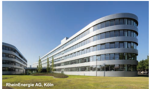
RheinEnergie AG, Köln

Dörken GmbH & Co. KG, Hagen Dräger Safety AG & Co. KGaA, Lübeck Dräxlmaier Group SE & Co. KG, Vilsbiburg DURIA eG, Düren Entleutner GmbH, Haag a. d. Amper Erbe Elektromedizin GmbH, Tübingen Excella GmbH & Co. KG, Feucht Fuchs Lubricants Germany GmbH, Kaiserslautern Futurhaus Lehel - Seitzstraße, München Gerling Quartier FQ16 UG, Köln Giesecke + Devrient GmbH, München GlaxoSmithKline Biologicals, Dresden Global Gate, Düsseldorf Hartmetall-Werkzeugfabrik Paul Horn GmbH, Tübingen Herma GmbH, Filderstadt Hofmann Leiterplatten GmbH, Regensburg ICL Ludwigshafen Service, Ludwigshafen Icon (ehem. West LB), Düsseldorf Imprimerie Hengen Sàrl, Luxemburg Infineon Technologies AG, Regensburg Infraserv Höchst Prozesstechnik GmbH, Frankfurt Jenoptik AG, Jena Jobst GmbH, Emmerich Knorr-Bremse AG, München Koenen Kunststofftechnik GmbH, Erkelenz Kronprinzenbau, Reutlingen Lindt & Sprüngli Hauptzentrale, Aachen