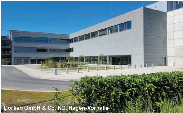
Dörken GmbH & Co. KG, Hagen-Vorhalle