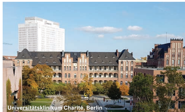
Universitätsklinikum Charité, Berlin

Schön Klinik, Eckernförde Schön Klinik, Rendsburg Schön Klinik, Vogtareuth Schwarzwald-Baar Klinikum, Villingen-Schwenningen Segeberger Kliniken, Bad Segeberg SLK-Kliniken - Klinikum am Gesundbrunnen - Kinderklinik, Heilbronn Sozialstiftung Bamberg - Klinikum am Bruderwald, Bamberg Sportklinik Stuttgart - Chirurgisches Zentrum, Stuttgart St. Bernward Krankenhaus, Hildesheim St. Christophorus-Krankenhaus, Werne St. Elisabeth-Krankenhaus, Salzgitte St. Johannes-Hospital, Dortmund St. Josef-Krankenhaus, Linnich St. Josefs Krankenhaus, Hilden St. Martinus-Krankenhaus, Düsseldorf St. Vincenz-Krankenhaus Limburg St.-Antonius Hospital, Eschweiler Städtisches Klinikum, Solingen Städtisches Klinikum Brandenburg Thoraxklinik, Heidelberg UKSH Universitätsklinikum Schleswig-Holstein - Campus , Lübeck Uniklinik RWTH Aachen Universitätskliniken, Heidelberg Universitätsklinikum, Augsburg Universitätsklinikum, Düsseldorf Universitätsklinikum, Freiburg