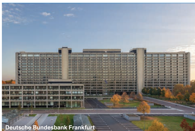
Deutsche Bundesbank Frankfurt