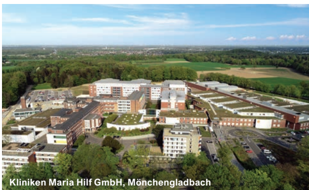
Kliniken Maria Hilf GmbH, Mönchengladbach

Bundeswehrkrankenhaus, Ulm Bundeswehr-Zentralkrankenhaus, Koblenz Caritas-Altenheim St. Elisabeth, Aachen Caritas-Krankenhaus, Bad Mergentheim Centre Hospitalier de Luxembourg, Luxemburg Centre Hospitalier du Nord, Ettelbrück Centre Medical, Luxemburg Charité - Universitätsmedizin, Berlin CHL Clinique d'Eich, Luxemburg Christliches Klinikum Unna Mitte, Unna Clinique privée du Dr. E. Bohler S.A., Luxemburg Clinique Sainte Marie, Esch-sur-Alzette Deutsches Herzzentrum, München DGD Lungenklinik, Hemer Diakonie Klinikum, Schwäbisch Hall Diakonie Klinikum Jung-Stilling, Siegen Diakovere Henriettenstift Kirchrode, Hannover DONAUISAR Klinikum, Deggendorf Dr. von Ehrenwall'sche Klinik, Bad Neuenahr-Ahrweiler DRK Blutspendendienst Baden-Württemberg-Hessen, Ulm DRK Kliniken Berlin Köpenick, Berlin DRK-Kinderklinik, Siegen DRK-Krankenhaus, Grevesmühlen DRK-Krankenhaus Mecklenburg Strelitz, Neustrelitz Eichhof-Stiftung Lauterbach - Krankenhaus, Lauterbach Elbe Kliniken Stade und Buxtehude, Stade Elisabeth-Krankenhaus, Essen Ev. Altenzentrum Haus am Römerkanal, Rheinbach Ev. Klinikum Köln Weyertal, Köln Ev. Krankenhaus, Castrop-Rauxel Ev. Krankenhaus, Düsseldorf Ev. Krankenhaus, Mettmann Ev. Krankenhaus, Mülheim Ev. Krankenhaus, Wesel Evangelisches Klinikum Niederrhein, Dinslaken & Duisburg Filderklinik Bonladen, Filderstadt Friedrich-Schiller-Universität - Poliklinik, Jena Gemeinschaftsklinikum Mittelrhein gGmbH, Koblenz Geriatrie-Zentrum Haus Berge, Essen