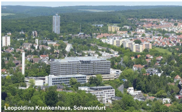
Leopoldina Krankenhaus, Schweinfurt

Krankenhaus Tabea GmbH, Hamburg Kreisklinik, Wolfratshausen Kreiskliniken, Reutlingen Kreisklinikum, Siegen Kreiskrankenhaus, Freiberg Kreiskrankenhaus des Vogelsbergkreises, Alsfeld KRH Klinikum Siloah, Hannover Landesklinikum Mostviertel, Amstetten Leben & Wohnen - Parkheim Berg, Stuttgart Leopoldina Krankenhaus, Schweinfurt Lubinus Clinicum, Kiel Luisenhospital, Aachen LVR-Kliniken, Süchteln, Viersen Maison de Soins, Clervaux Maria-Hilf-Krankenhaus, Bergheim Marien Hospital, Witten Marienhospital, Stuttgart Medical Park Loipl, Bischofswiesen medius Klinik Nürtingen Medizinische Universität Lausitz - Carl Thiem, Cottbus München Klinik Harlaching, Schwabing & Thalkirchner Straße Niels-Stensen-Kliniken - Krankenhaus St. Raphael, Ostercappeln Nikolauspflge, Stuttgart Oberschwabenklinik - St. Elisabethen-Klinikum, Ravensburg Ökumenisches Hainich Klinikum, Mühlhausen Ortenau Klinikum, Lahr-Ettenheim Orthoklinik, Lüneburg Rehabilitationszentrum am Sprudelhof, Bad Nauheim Rheinland Klinikum, Dormagen Rhein-Maas Klinikum GmbH, Würselen RKH Kliniken, Ludwigsburg RKH Orthopädische Klinik, Markgröningen RKH-Kliniken, Bietigheim Robert Bosch Krankenhaus, Stuttgart Robert-Bosch-Krankenhaus, Standort City, Stuttgart Sana Hanse-Klinikum, Wismar Sana Kliniken Niederlausitz, Senftenberg Sana Krankenhaus Benrath, Düsseldorf Sana-Klinikum Lichtenberg, Berlin