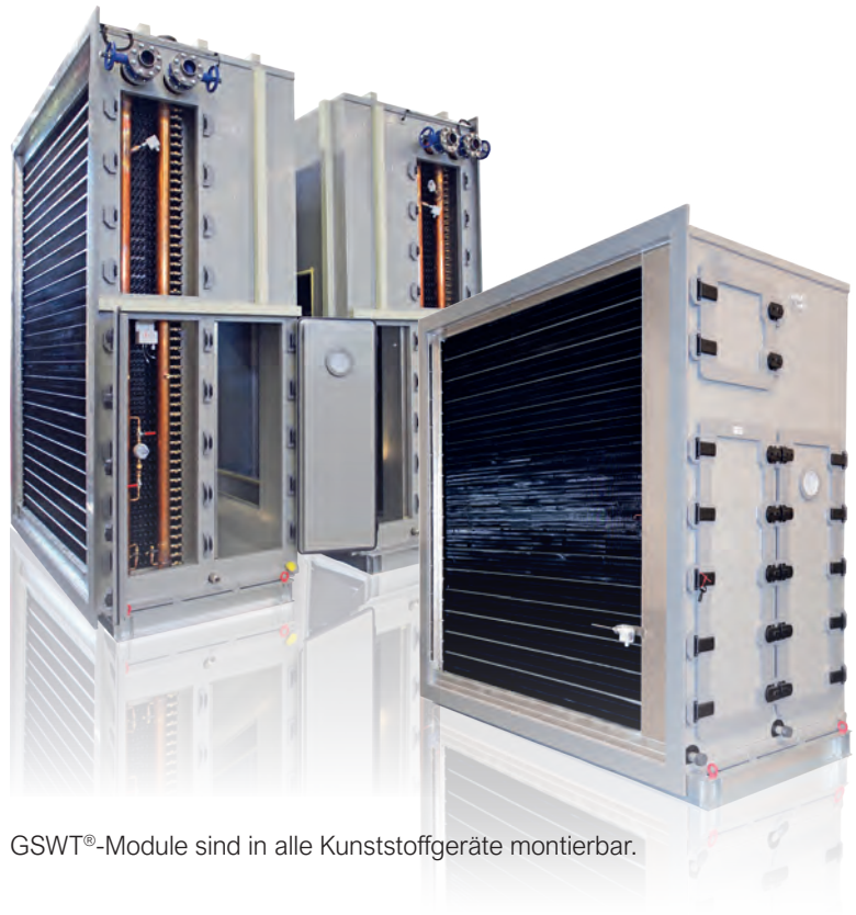
GSWT®-Module sind in alle Kunststoffgeräte montierbar.

Das Ergebnis: maximale Betriebssicherheit, reduzierte Wartung und deutliche Einsparungen bei den Betriebskosten – besonders dort, wo höchste Luftqualität und absolute Verlässlichkeit entscheidend sind.